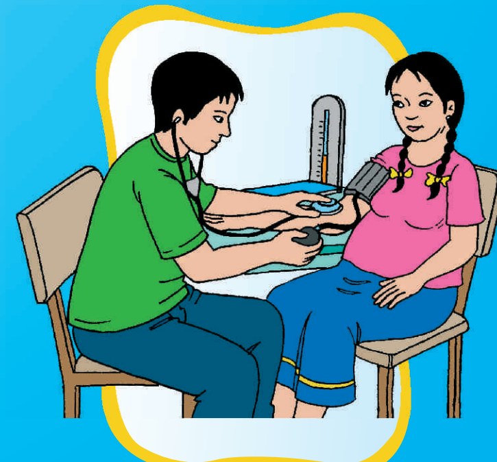
CONTROLA TU PRESIÓN