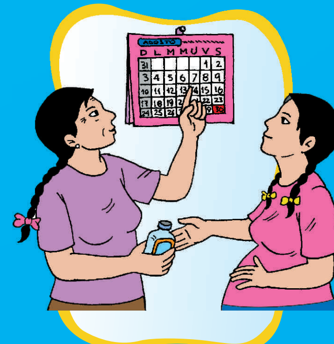
RECIBE Y TOMA LAS VITAMINAS QUE TE DAN