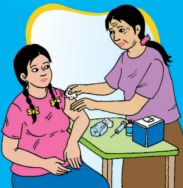
RECIBE LA VACUNA ANTITETÁNICA