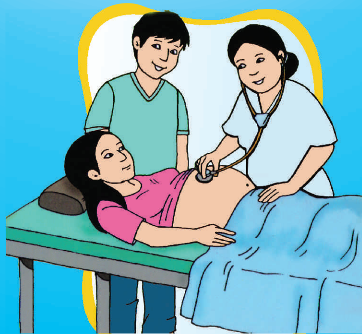
ASEGÚRATE QUE TU NIÑO ESTÁ CRECIENDO BIEN